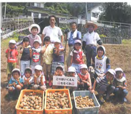
ジャガイモの収穫をする古里保育園児

耕作放棄された畑を借用し こんにやく玉や治助イモの栽 培を推進し、農業振興や収穫 作物を販売し、センター事業 の普及、啓発に努めています。 また、獅子舞用わらじを販売 し、伝統文化の継承を応援し ています。