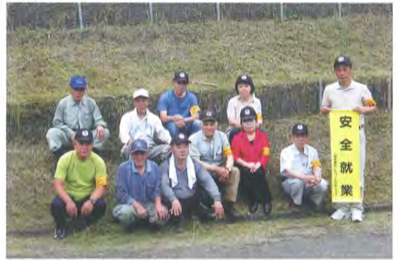
(安全管理委員によるパトロール)