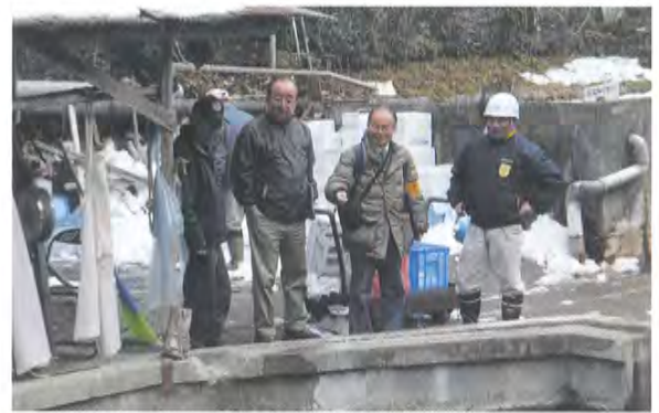
(財団指導員による現地指導)