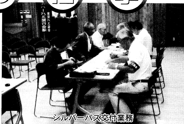
シルバーパス交付業務