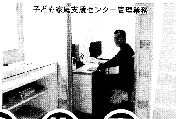
子ども家庭支援センター管理業務