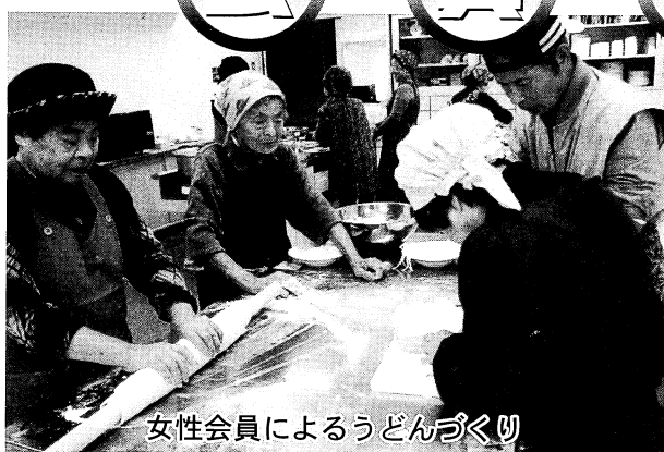
女性会員によるうどんづくり