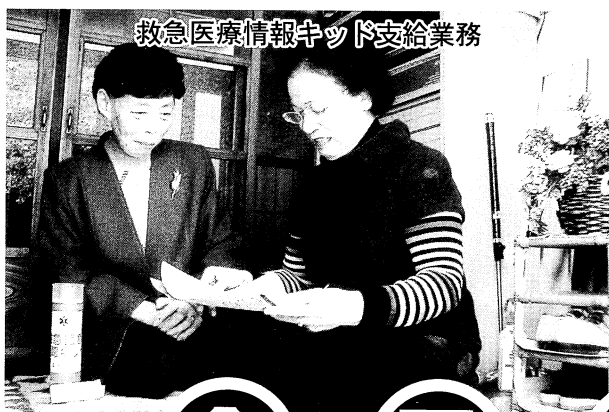
救急医療情報キット支給業務