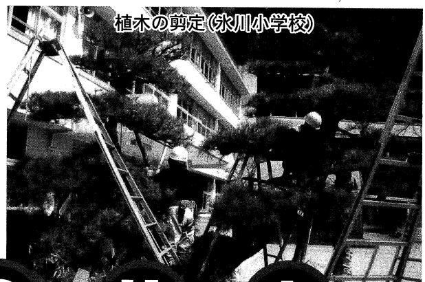
植木の剪定(氷川小学校)