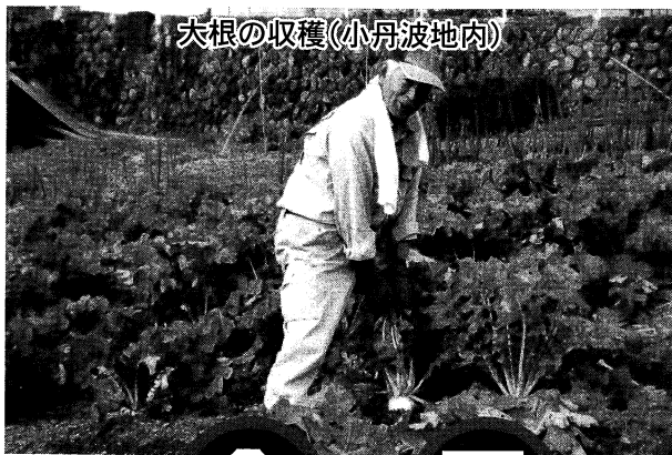
大根の収穫(小舟波地内)