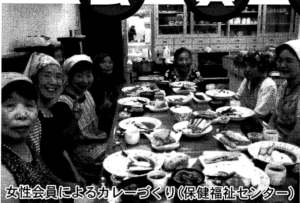
女性会員によるカレーづくり(保健福祉センター)