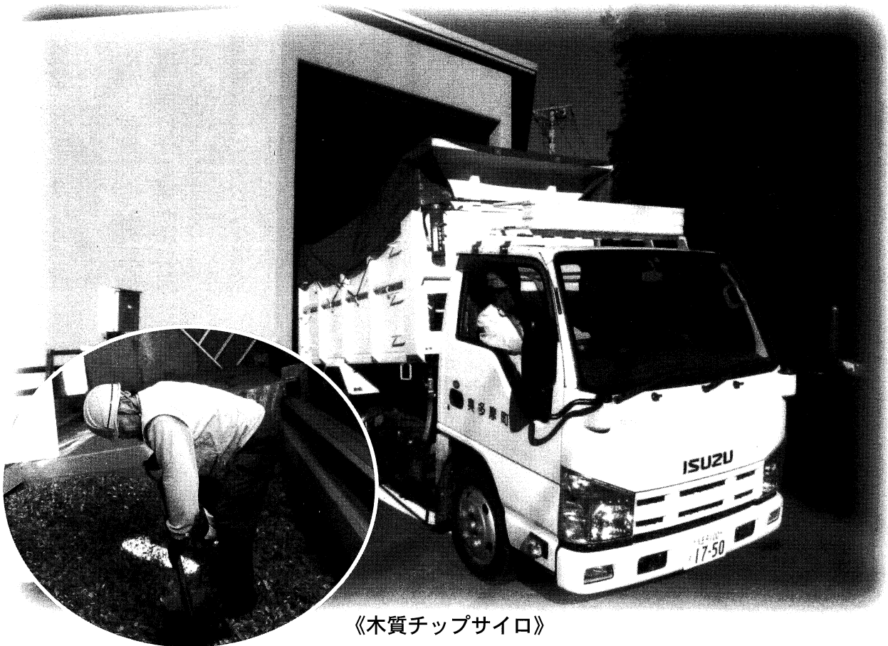
《木質チップサイロ》

東京都西多摩郡 奥多摩町氷川 954-11 電話 (0428)83-2815 FAX (0428)83-3108 ホームページアドレス http://www.okutama-sjc.or.jp/