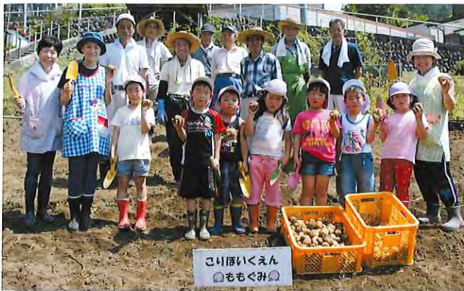
7月13日 古里保育園児によるじゃがいも収穫