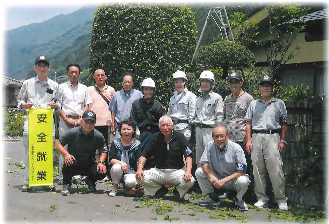
長畑地内植木剪定作業現場

東京都西多摩郡 奥多摩町氷川954-11 電話 (0428)83-2815 FAX (0428)83-3108 ホームページアドレス http://www.okutama-sjc.or.jp/