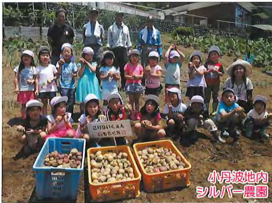
小丹波地内 シルバー農園

耕作放棄された畑を借用しじゃがいもや里いも、ネギなどを栽培し、農業振興や収穫物を販売し、センター事業の普及、啓発に努めています。 6月20日には、古里保育園児19名がじゃがいもの収穫をし、豊作で大喜びでした。