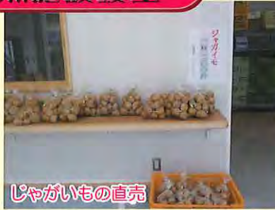
じゃがいもの直売