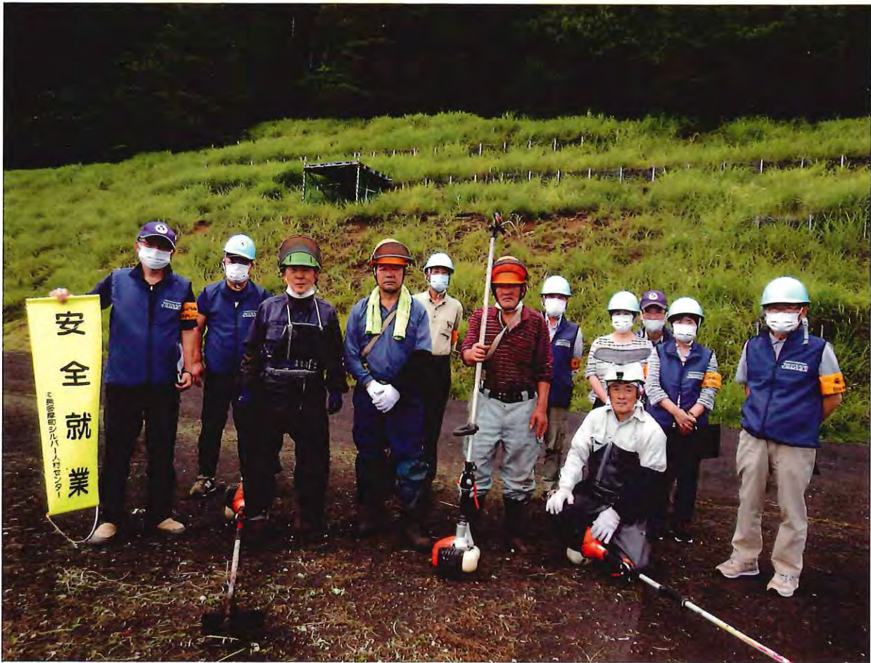
氷川地内草刈り現場視察

東京都西多摩郡 奥多摩町氷川 954-11 電話 (0428) 83-2815 FAX (0428) 83-3108 ホームページアドレス http://www.okutama-sjc.or.jp/