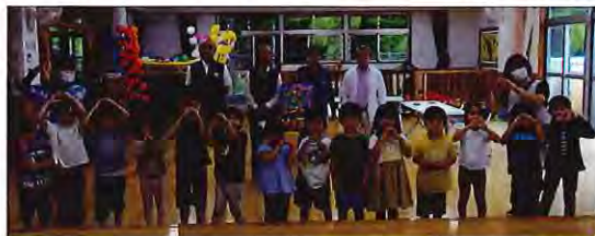
ジャガイモの植付作業をした園児達と記念撮影