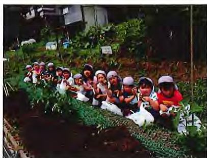
古里保育園児の皆さんが自分で植付けたジャガイモを収穫しました(6月28日撮影)