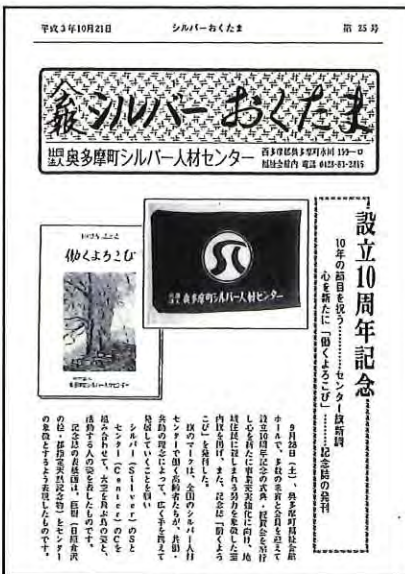
第25号 1991.10.21 発行