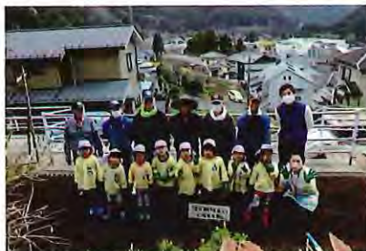
古里保育園児の皆さんと一緒にジャガイモの種芋を植え付けました。(3月28日撮影)

当センターでは、耕作放棄された畑を借用して、ジャガイモ（治助芋等）や里イモ、大根などを栽培しています。収穫した作物は、町のふれあいまつりなどで販売し、セクター事業の普及、啓発に努めています。