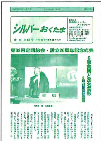
第57号 2001.10.25 発行