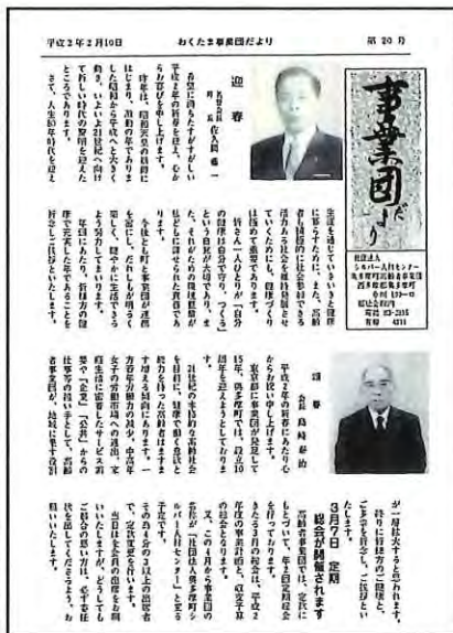
第20号 1990.2.10 発行