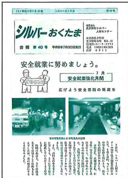
第40号 1996.7.30 発行