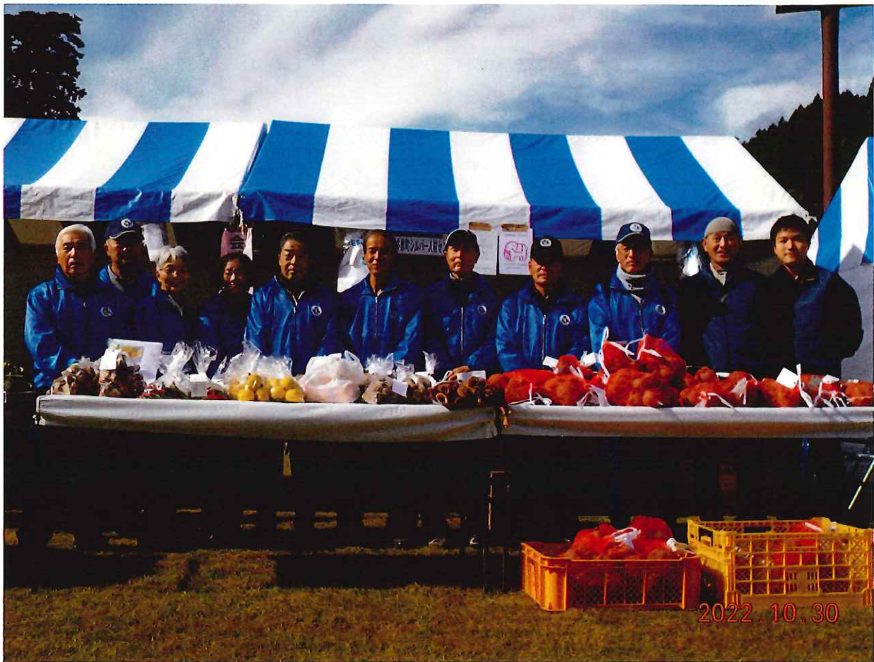
シルバー人材センター物産販売コーナー（奥多摩総合運動公園）

東京都西多摩郡 奥多摩町氷川 954-11 電話 (0428) 83-2815 FAX (0428) 83-3108 ホームページアドレス http://www.okutama-sjc.or.jp/